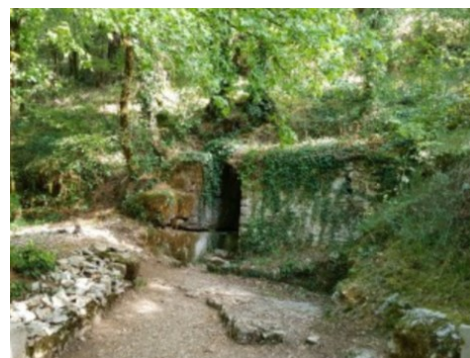
Entrée de la fontaine de Berthiol.