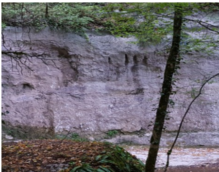
Petit gris à gauche et griffure à droite.

Après une nuit et une balade libératrice jonchée de clins d'œil 4D nous nous dirigeons vers Padirac où nous tombons sur son gouffre et nos mémoires souterraines entropiques. Nous étions dans ce gouffre et nous ne comprenions pas sur le moment le sens de cette visite.