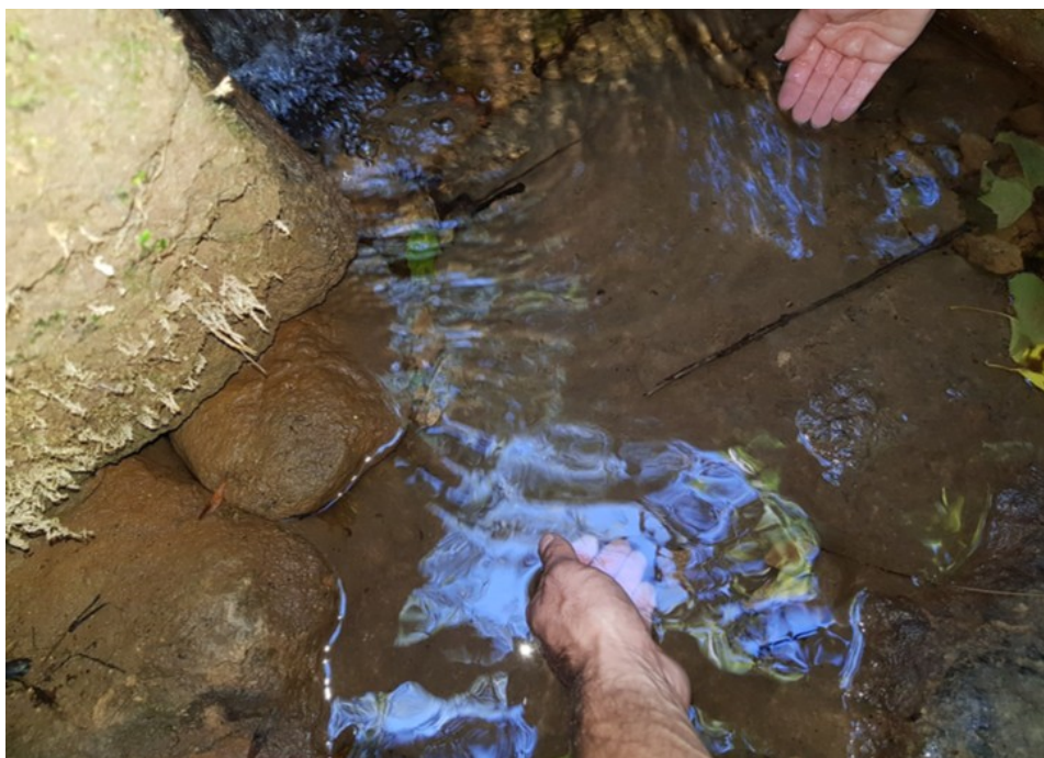
Tête de Léonidé en bas et poisson en haut.