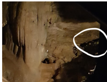
100 mètres sous terre à Padirac Œil reptilien.