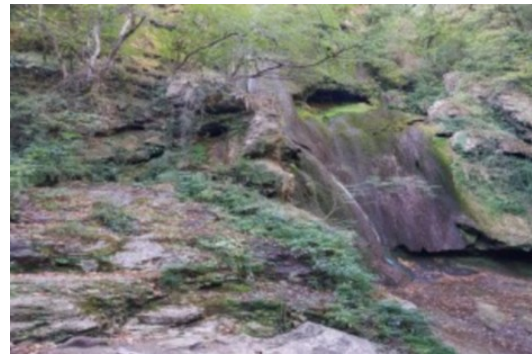
Cascade asséchée laissant apparaître un visage

Après une nuit et une balade libératrice jonchée de clins d'œil 4D nous nous dirigeons vers Padirac où nous tombons sur son gouffre et nos mémoires souterraines entropiques. Nous étions dans ce gouffre et nous ne comprenions pas sur le moment le sens de cette visite.