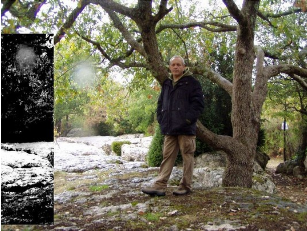
Materialización de mi guía, a mi lado.

Por ello, el humano ignorante de las otras realidades temporales ha confundido mucho tiempo esas presencias con demonios de la sombra o entidades malintencionadas, que se ha apresurado a querer ahumar por el incienso o “cazar a exorcismos”. Hoy, esas realidades multidimensionales comienzan a ser reveladas al hombre a cuentagotas, ya que algunos físicos salidos de su clase, han aceptado revelar la realidad vibratoria y cuántica del Universo. La ciencia cuántica ha descubierto no hace mucho tiempo, que la frecuencia vibratoria de un objeto define su forma en un espacio –tiempo bien determinado. Lo que significa por ejemplo que a vuestros ojos una roca, no es forzosamente una roca en otra dimensión, sino quizá una casa o un edificio cualquiera. Al igual que un cuerpo biológico puede tener diferentes aspectos según la dimensión vibratoria en la cual su Alma expresa su creación.