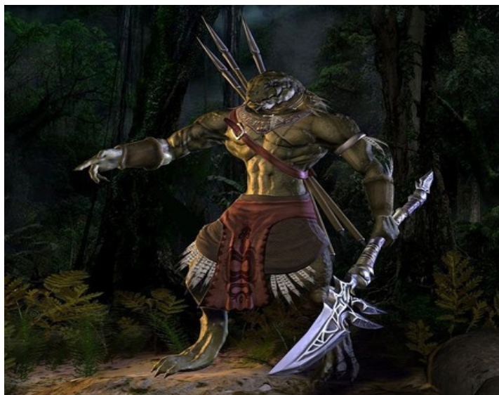
Personaje parecido a un Ser reptiliano guerrero.

Es esta misma parte primaria del encéfalo que es responsable de la “maleabilidad” del campo magnético del ego. Ella integra las características específicas de la “herencia funcional” que les han dejado ciertos linajes de vuestros creadores. Es además a través de la Evolución del Alma, que ese “patrimonio funcional” se ha vuelto de encarnación en encarnación, vuestro emocional de hoy induciendo vuestros comportamientos.