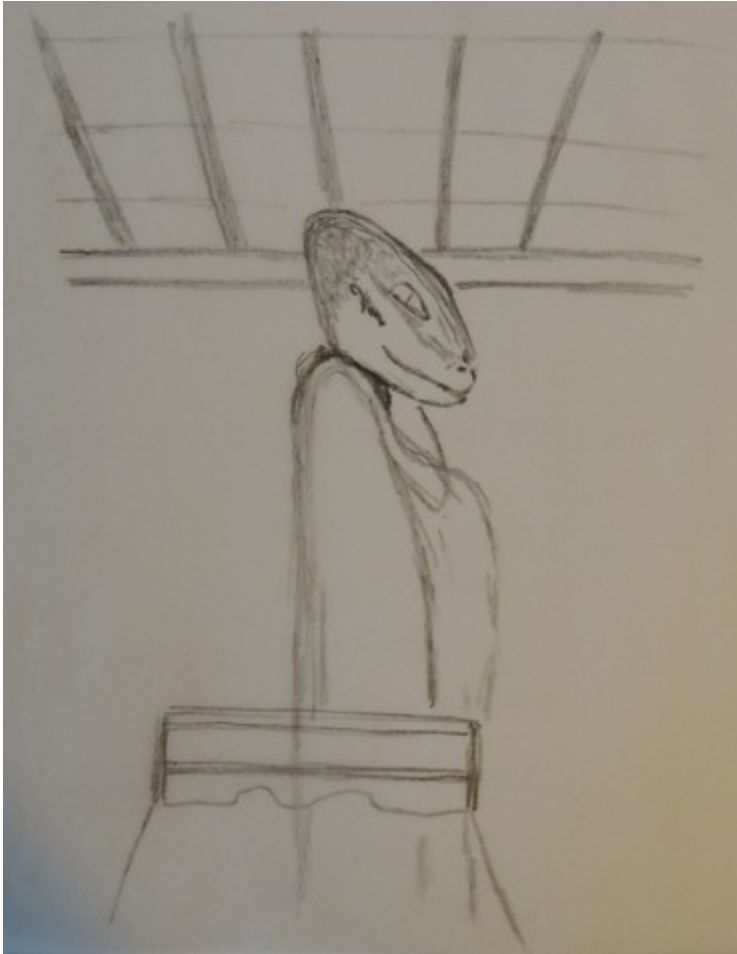
Croquis del Ser “Amassutum” que se ha materializado en el cuarto de Jenaël.

El “Kiristos” es pues a la vez un acelerador del camino del Alma y un acelerador de la evolución de la raza humana. Este artificio genético implantado por los planificadores de vida “Kadistu”, ha permitido a la raza humana subirse en este fin de los tiempos, al rango de candidato al pueblo galáctico.